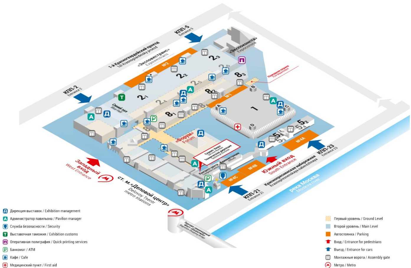
СХЕМА ЦВК «ЭКСПОЦЕНТР» LAYOUT OF EXPOCENTRE FAIRGROUNDS